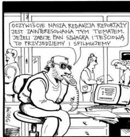
/Andrzej Mleczko, http://mleczko.interia.pl/galerie/o-mediach/zdjecie,429153,12/